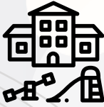
Educación especial infantil y primaria