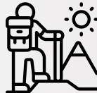
Salidas recreativas y culturales