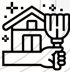
Actividades vida diaria